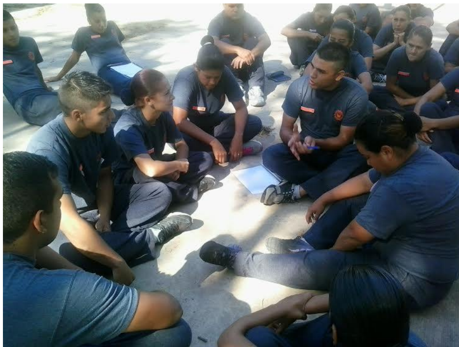
Figura 1 . Juego de roles

El análisis de la percepción, habilitar el entendimiento del que ve, siente, piensa y dice de modo distinto fue un gran valor agregado a la formación: entender al otro como legítimo otro, al decir de Humberto Maturana, partiendo de la aceptación y el respeto por uno mismo, en base al análisis del papel de la policía y del ideario del cuerpo policial en su inserción en la sociedad. Ese entendimiento del conflicto y de las distintas percepciones que lo habitan es significativo para lograr la cercanía del cuerpo policial a la ciudadanía. Vinyamata señala: “cuando la policía cambia su percepción de la ciudadanía y deja de ser un cuerpo extraño enquistado en la sociedad, la relación será completamente diferente, acoplando los métodos a una realidad en la que el uso de la fuerza acabará siendo mínima y la eficacia social frente al conflicto multiplicada” .