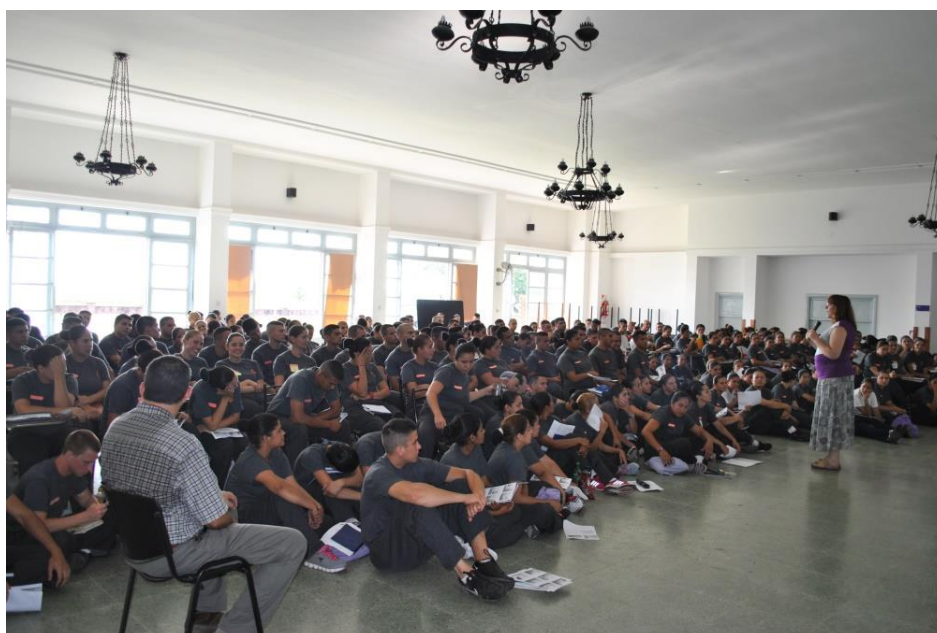
Figura 2. Entendiendo el conflicto

Entonces vemos como el campo restaurativo contiene una multiplicidad de intervenciones y posibilidades de aplicación dentro del accionar policial.