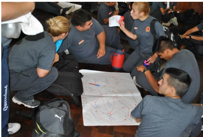
Figura 5. Ejercicio: Mapeo de redes

Consideramos que la estrategia metodológica diseñada por el equipo docente resultó apropiada a los destinatarios del curso, lo cual fue ampliamente manifestado tanto en la evaluación en proceso como en la final. Evidenciamos que los estudiantes tienen mayormente desarrollada la destreza visual y en menor medida su expresión escrita, por lo que decidimos reforzar esta habilidad, a través de la presentación de los trabajos prácticos por escrito. A tales efectos se diseñaron instrumentos específicos para cada una de las instancias individuales y grupales.